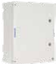
Tableros en material termoendurecido con puerta ciega IP66