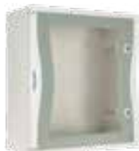
Tableros en material termoendurecido con puerta transparente IP66

Equipamiento: llave con inserto triangular, tapones cubre tornillos para doble aislamiento.