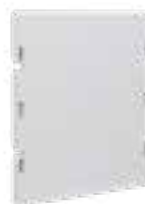
Puertas internas reversibles Click Cube en material termoendurecido

Equipamiento: provistos de tornillos para su fijación.