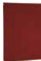
Placas de fondo en material termoendurecido

Equipamiento: provistos de tornillos para su fijación.