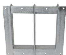
B frame 6x2 galv