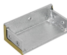
B SHORTSIDE 120 GALV