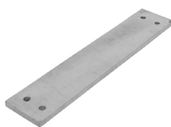
B PART WALL SIZE 6 GALV