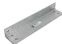
B LONGSIDE SIZE 6 GALV