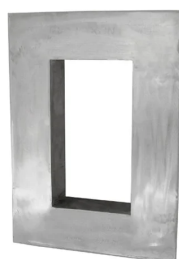
G 6x1 AISI316