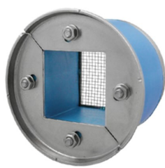
R 100 AISI316