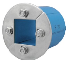
R 70 AISI316