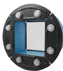
R 150 GALV WITH NET