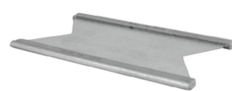
STAYPLATE 120 GALV