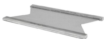
STAYPLATE 120 AISI316