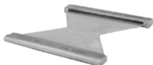
STAYPLATE 60 AISI316