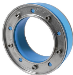
SPM 138 seal